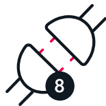
8 puntos de anclaje