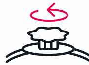
2 tipos de ajuste de arnes