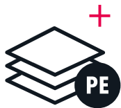
Carcasa fabricada en polietileno