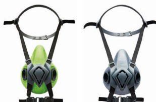
Medias máscaras BLS 4000 neXt S - BLS 4000 neXt R