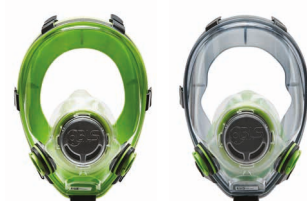
Máscaras completas BLS 5700 - BLS 5600